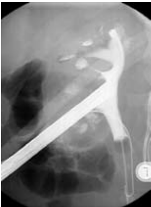
Röntgenbild mit dem in die Niere eingebrachten Endoskop

Die Risiken des Verfahrens sind gering. Eine durch die Punktion der Niere ausgelöste Blutung stoppt fast immer von selbst. In den seltenen Fällen einer verstärkten Blutung kann diese fast immer durch selektiven Verschluss des blutenden Gefäßes gestillt werden. Daneben kann es zum Auftreten von Fieber kommen, was eine kurzfristige Antibiotikatherapie notwendig macht. Ernste Verletzungen der Niere sind mit den dünnen Instrumenten extrem selten.