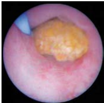
Rigide Ureterorenoskopie mit endoskopischer Entfernung eines Harnleitersteins