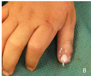
Hexadaktylie: präOP (7) und postOP (8)