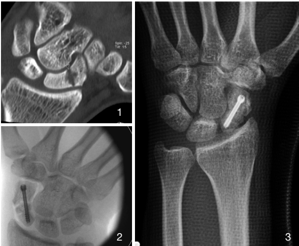
Scaphoidpseudarthrose: CT (1), intraOP (2) und postOP (3)