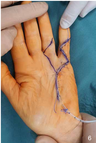
M. Dupuytren: präOP (4), intraOP (5) und postOP (5)